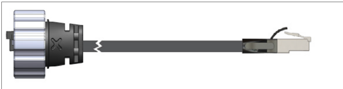
Abb. 2: Abmessungen C6 X1-C1