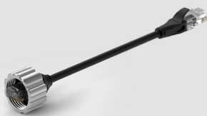
Kabel für PoE