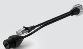
Kabel für PoE und Ethernet/USB