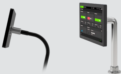
Schwanenhalshalterung und Rohrbefestigung